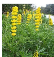
Gele zoete lupine